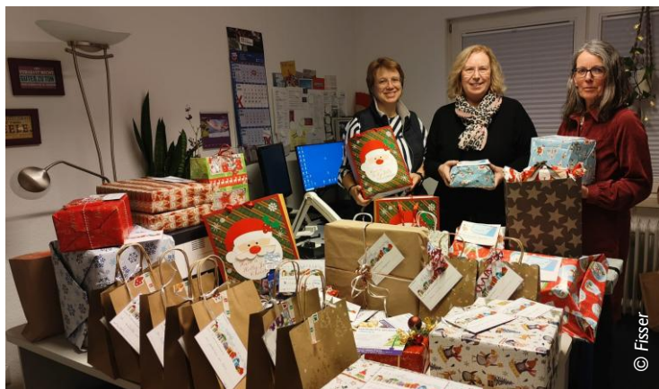
Viel Freude beim Verschenken