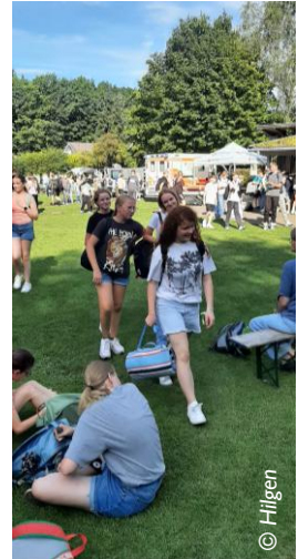
Spiel und Spass