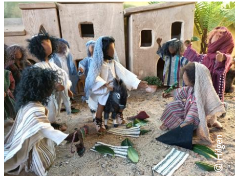
Einzug in Jerusalem

Somit ist der Ostergarten kein statisches Gebilde, sondern immer in der Entwicklung. Diejenigen Personen, die die jeweiligen Szenen aufbauen, haben Freude am