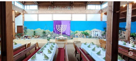
Tischabendmahl in der Gethsemane-Kirche

Auch Führungen durch den Ostergarten sind möglich und können bei Pfarrer Hilgen angemeldet werden. Ebenso finden besondere Veranstaltungen im Ostergarten statt. Neben den sonntäglichen Gottesdiensten gibt es jeden Mittwoch eine Andacht zur jeweils biblischen Szene. Am Sonntag Lätare, dem sogenannten kleinen Osterfest in der Passionszeit wird ein Kaffeetrinken im Ostergarten angeboten und Gründonnerstag findet das Feierabendmahl im Ostergarten statt. (Foto3)