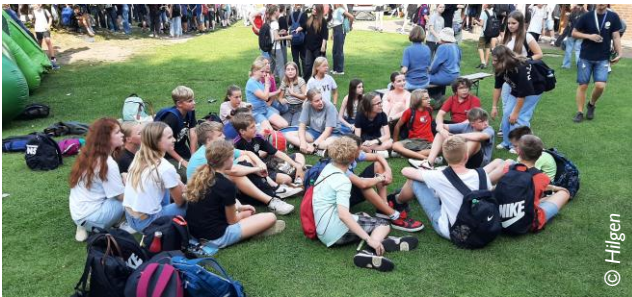
Konfitag auf dem Jugendhof Vechta

Nach fast zweijähriger gemeinsamer Konfizeit werden am 11. Mai 2025 um 10.00 Uhr in der Gethsemane-Kirche in Bakum folgende junge Menschen konfirmiert: