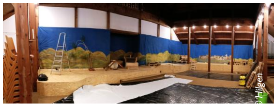
Aufbau in der Kirche

che zu Woche weitererzählt. Jede Figur wird dafür in die Hand genommen und umgestellt. Szenen werden so neu dargestellt.